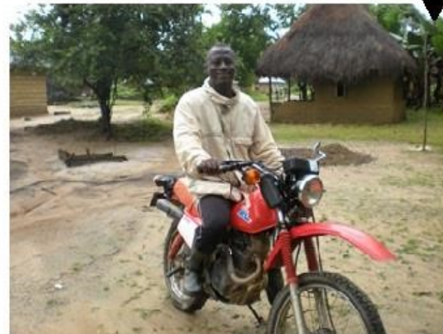
MOTORCYCLE USED FOR ACCESSING OPERATIONAL COMMUNITIES